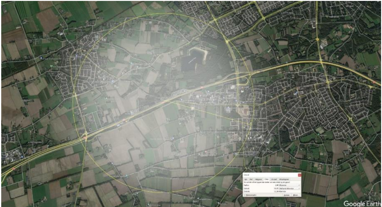
Figuur 1. Cirkel van 1,8 km waarop ledschermen nog leesbaar zijn (vermeld door ontwikkelaar in Brabants Dagblad)

Wij vragen om de omgevingsdialogoog alsnog te voeren en daarbij een passende omvang van de omgeving in acht te nemen. Tot dat de omgevingsdialogoog voldoende is gevoerd kan een omgevingsvergunning niet worden verstrekt, en derhalve vragen wij om de verleende omgevingsvergunning in te trekken.