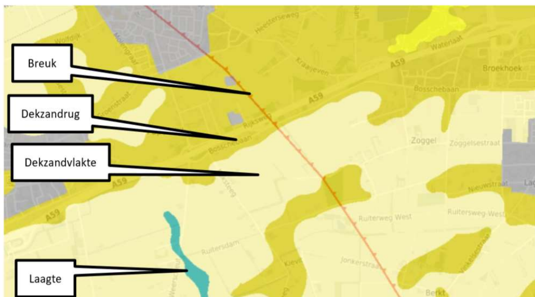
Figuur 17.5 Geomorfologie

Punt 13: Centraal door Heesch West ligt een breuklijn, een zijbreuk van de oostelijker gelegen Peelrandbreuk. Ten oosten ervan, de Peelhorst, is het landschap in de geologische geschiedenis gestegen en ten westen ervan de Roerdalslenk, is het landschap gezakt. In het landschap is de breuk